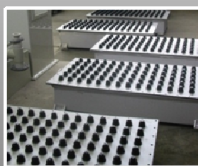
Så er der dømt dysebund!