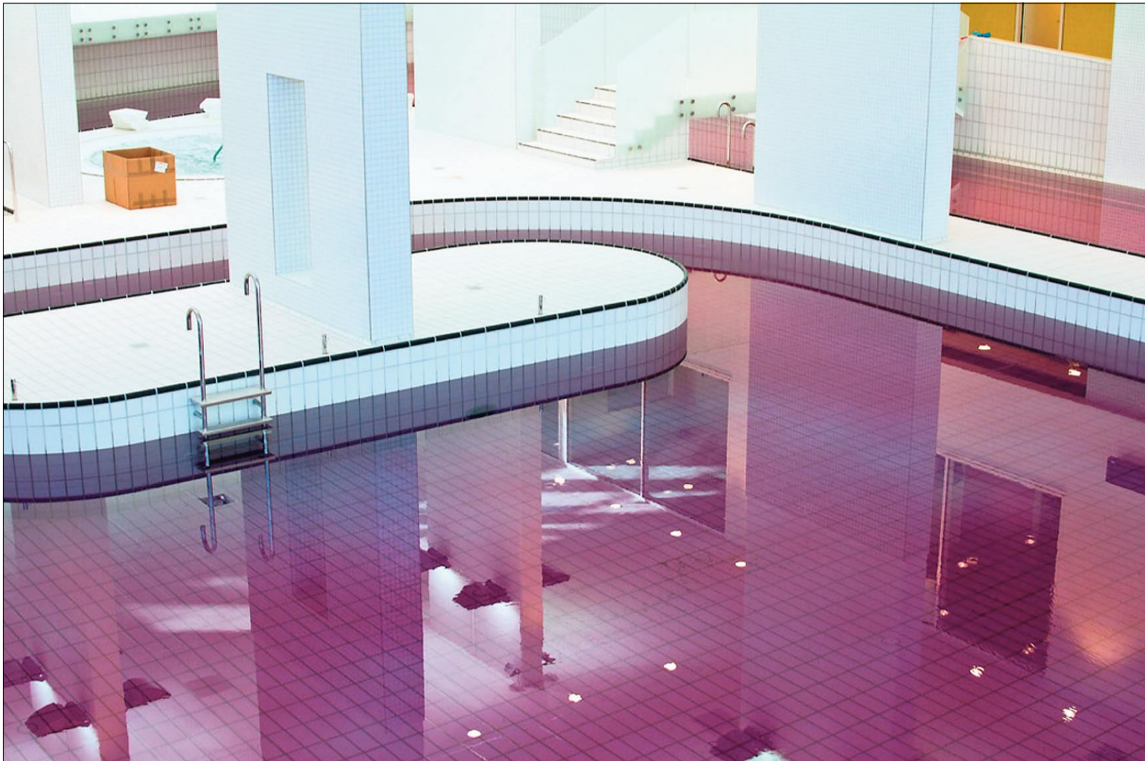
Normalt er vandet i bassinerne i DGI-Huset 100 procent rent og dermed blå, men sådan var det ikke i sidste uge, da vandet pludselig havde farve, som om der var tabt rødbered ned i vandet. Det var en test af dyserne, som skal tilføre klor, og de virkede.

Hvis der er døde områder i bassinet, hvor der ikke kommer klor i, risikerer folk at blive syge